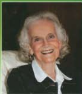
Por: Ruth Bell Graham